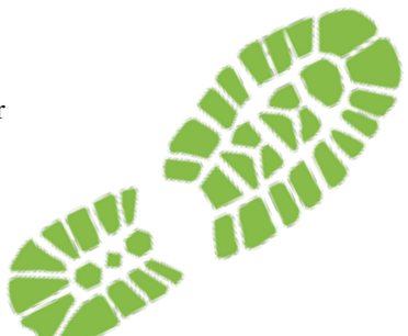
Werner Langhans Erster Bürgermeister